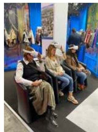
<Foto: esperienza in realtà virtuale (gennaio 2026)>

La qualità unica e ineguagliabile dei tessuti giapponesi affonda le proprie radici nei distretti produttivi sviluppatasi in tutto il Paese, ciascuno dei quali ha saputo preservare e far evolvere nel tempo caratteristiche distintive proprie, valorizzando al massimo le risorse locali e l'identità del territorio. "Focus sui distretti tessili" è un progetto nato per valorizzare il fascino dei distretti tessili giapponesi e promuoverli a livello internazionale. La prima edizione è stata dedicata al denim giapponese, rinomato in tutto il mondo, mentre la seconda ha posto l'accento sulla lana del distretto di Bishu. In questa edizione, il progetto è dedicato al distretto della maglieria di Wakayama.